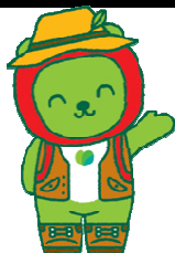
長野県 P-Rキャラクター「アルクマ」 (信州 D Cバージョン) ©長野県アルクマ

「毎月人口異動調査」の結果は インターネットでも提供しています。 アドレス http://www3.pref.nagano.lg.jp/tokei/1_jinkou/jinkou.htm